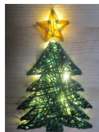
Holzbrett mit Tannenbaum Beleuchtung 4,50 €