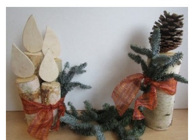
Zapfenkerze 4,50 € 4 Birkenholz-Kerzen 5,50 €