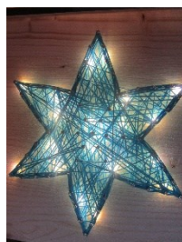
Holzbrett mit Stern Beleuchtung 4,50 €