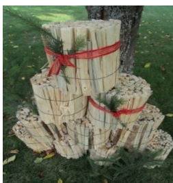
Anfeuerholz Bund 2,50 € 3 Bund 6,50 €

Wir hoffen, dass wir so den Förderverein unterstützen können und das Angebot genutzt wird. Für Fragen sprechen Sie uns gerne an und geben es bitte auch an andere weiter. Vielen Dank!